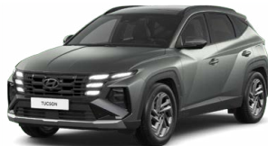
Pine Green Matt Matná Cena: 15 000 Kč