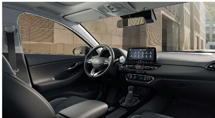
Černý interiér Oceanidís Black Premium – kožené čalounění sedadel – světlé čalounění stropu a obložení bočních sloupků – černé provedení přístrojové desky a výplně dveří