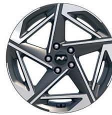
18" kola z lehké slitiny – N Line Premium