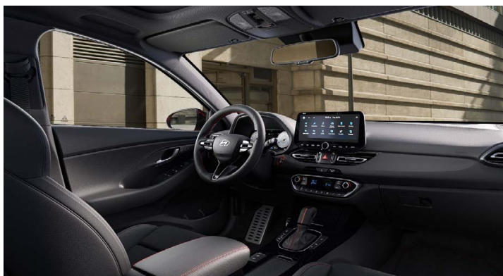
Černý interiér N line Premium – prémiové čalounění v kombinaci kůže/semiš – červeně prošívání sportovní volant, hlavice řadící páky a loketní opěrka