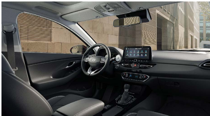
Černý interiér Oceanidís Black – látkové čalounění sedadel – světlé čalounění stropu a obložení bočních sloupků – černé provedení přístrojové desky a výplně dveří