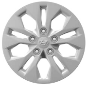
15" ocelová kola s celoplošnými kryty