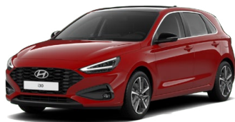
Engine Red Pastelová Cena: 0 Kč